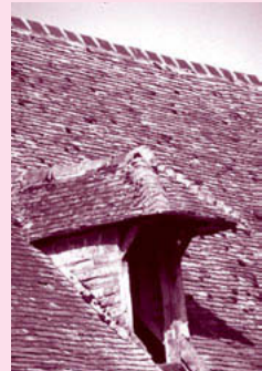
Lucarne à la capucine.