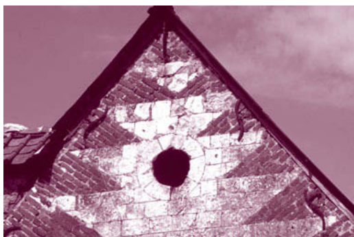
Oculus traditionnel des pignons de l'Artois et de la Flandre.