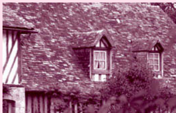
Lucarnes à bâtière.