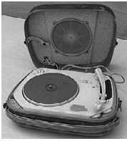
L'électrophone Teppaz préfigure dès 1960 la liberté, l'individualité, le nomadisme.