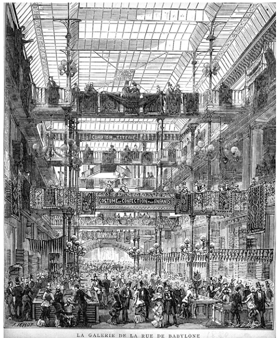
La galerie Babylone du Bon Marché (1880).

Construction du Grand Palais en France, confirmant, après le Crystal Palace, la conjugaison de l'art et de l'industrie dans le style Art nouveau.