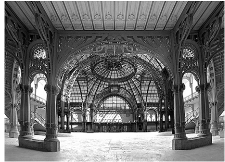
Vue générale du Grand Palais, nouveau lieu d'événements pour le XXI e siècle. À droite, la nef 1 .