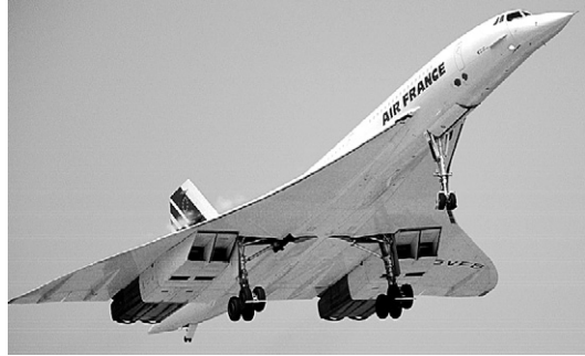
Le Concorde, symbole de l'alliance de la fonctionnalité et de l'esthétisme. Pensé dès 1960, il s'arrêtera définitivement de voler au début du XXI e siècle.

Création du siège Sacco (« poche » molle remplie de polystyrène expansé), du pop dans les objets de consommation et dans les packagings, y compris sur les pochettes de disques avec « Sargent Pepper's » des Beatles.