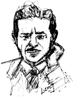
Raymond Loewy