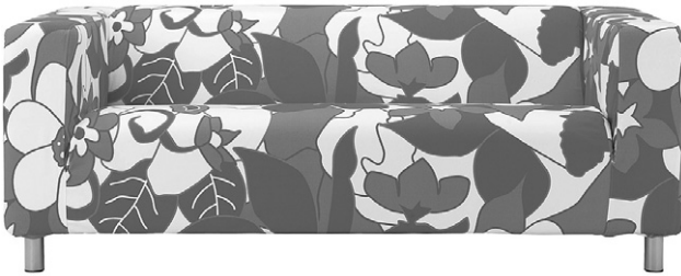
Ikea : le canapé pour le plus grand nombre. Ici, le modèle Klippan existe depuis plus de trente ans.

Le premier choc pétrolier induit une nouvelle façon de consommer, donc de repenser les objets (moins de plastique). Prise de conscience des limites des ressources naturelles.