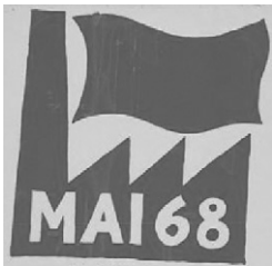
Mai 68 : le graphisme libre des affiches de Mai 68 préfigure le graffiti puis le tag. Il appartient à notre culture graphique et sera plus tard utilisé par détournement en design et en commu- nication.