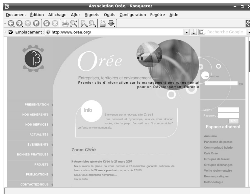
Figure 1-3 Exemple de site web proposant une partie destinée aux seuls adhérents (accessible dans la colonne de droite)

L'assemblée générale est une nécessité légale pour les associations Loi 1901. Un tel événement oblige traditionnellement à brasser une grande quantité de papier : il faut envoyer l'ordre du jour suffisamment à l'avance, tenir la liste des présents et, à l'issue de la réunion, en publier un compte rendu.